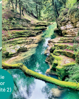
Sortie du Gor (intensité 2)