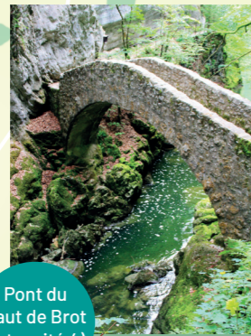
Pont du Saut de Brot (intensité 4)