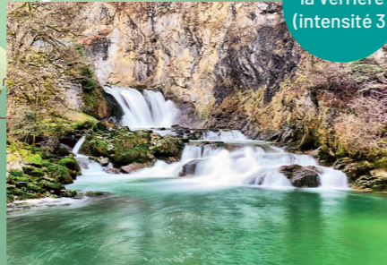
Chute de la Verrière (intensité 3)