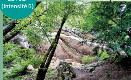
Baume du Four (intensité 5)